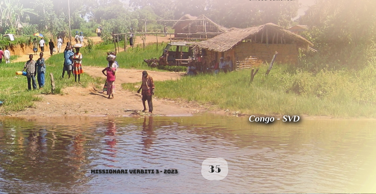
Congo - SVD

I prossimi Capitoli Provinciali e il Capitolo Generale del 2024 si interesseranno senz'altro di tali delle proposte , data l'importanza dei religiosi fratelli nella missione evangelizzatrice della Chiesa cattolica.