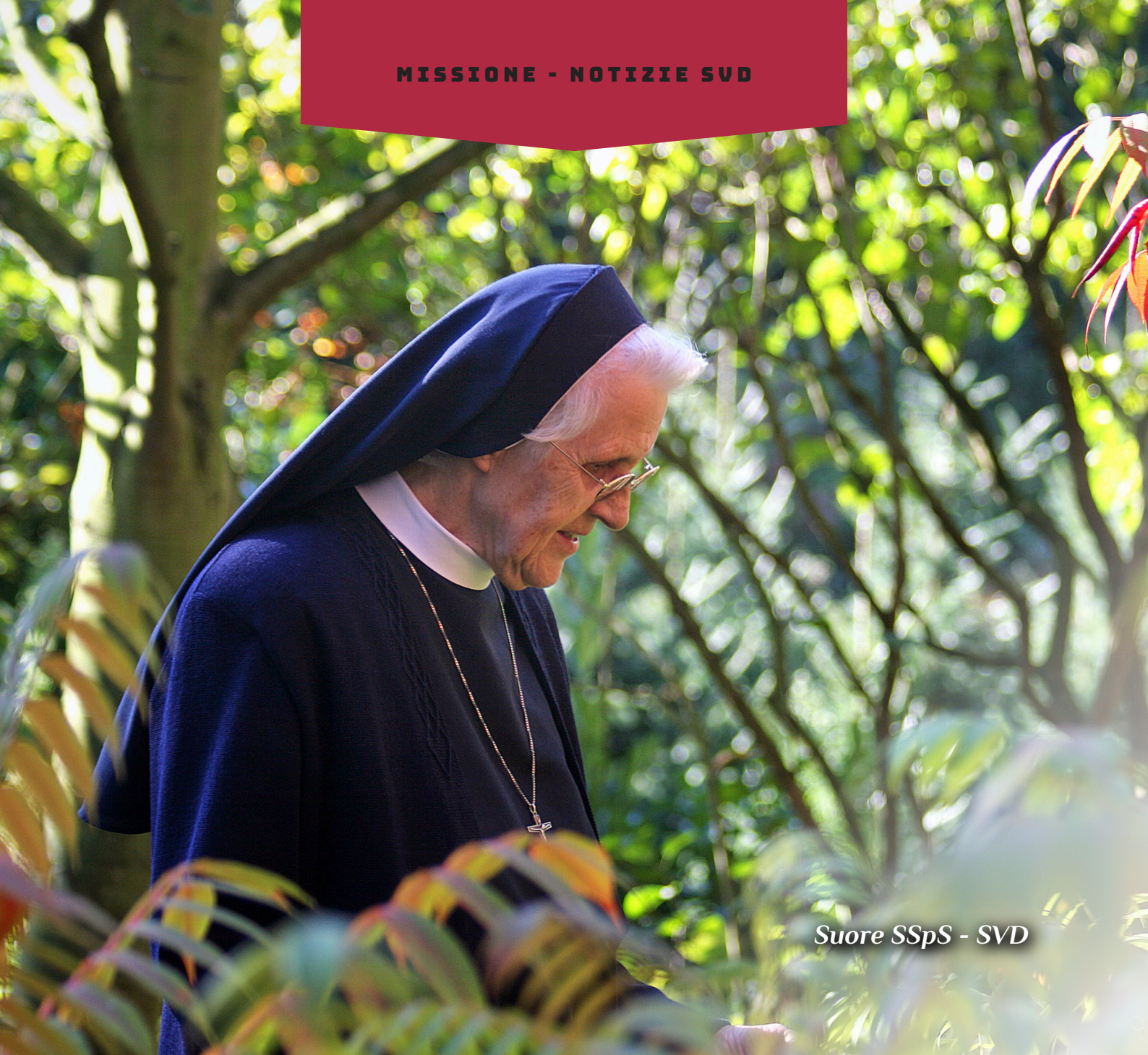
Suore SSpS - SVD