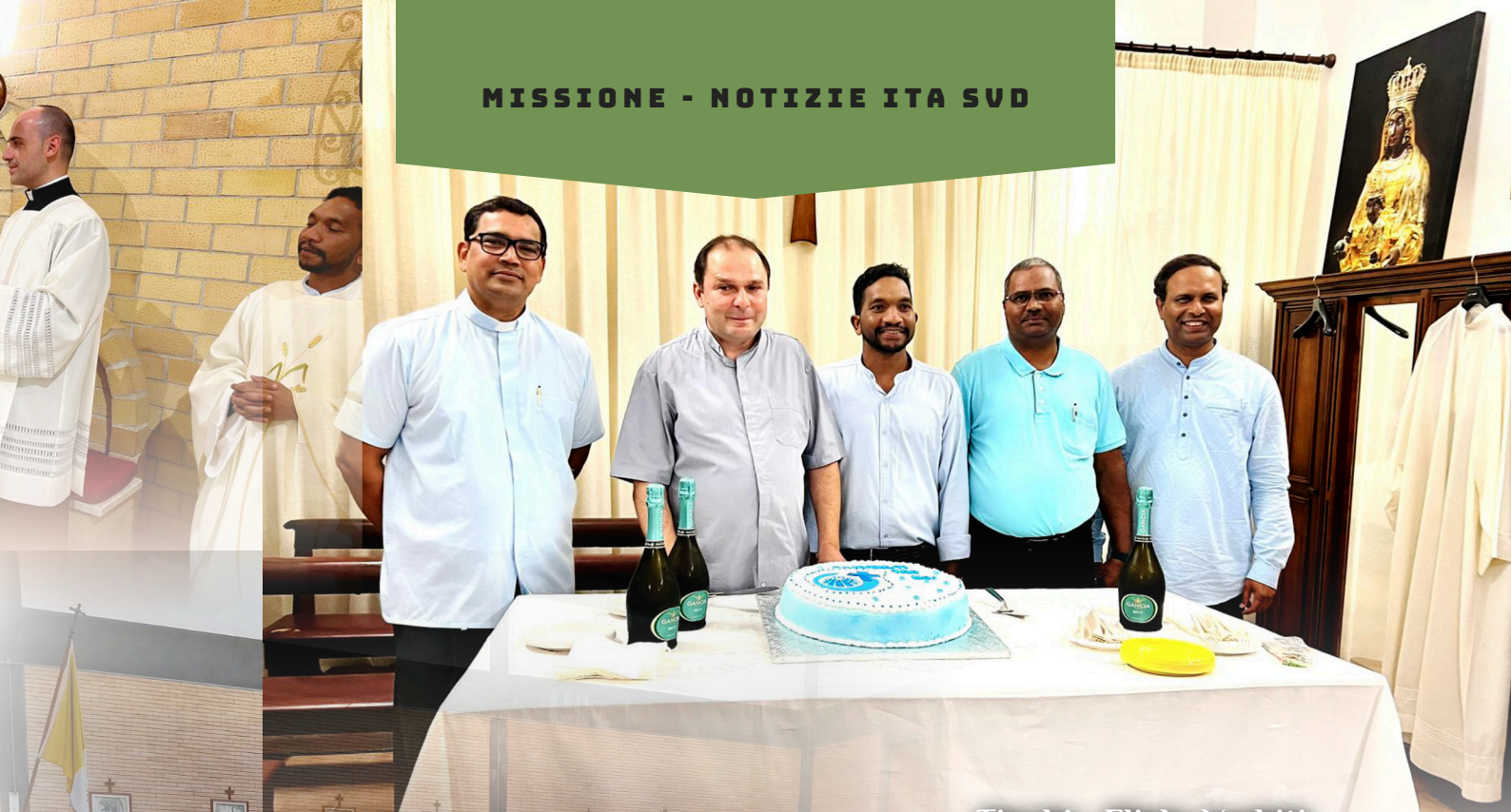
Tinchi - Flickr Verbiti