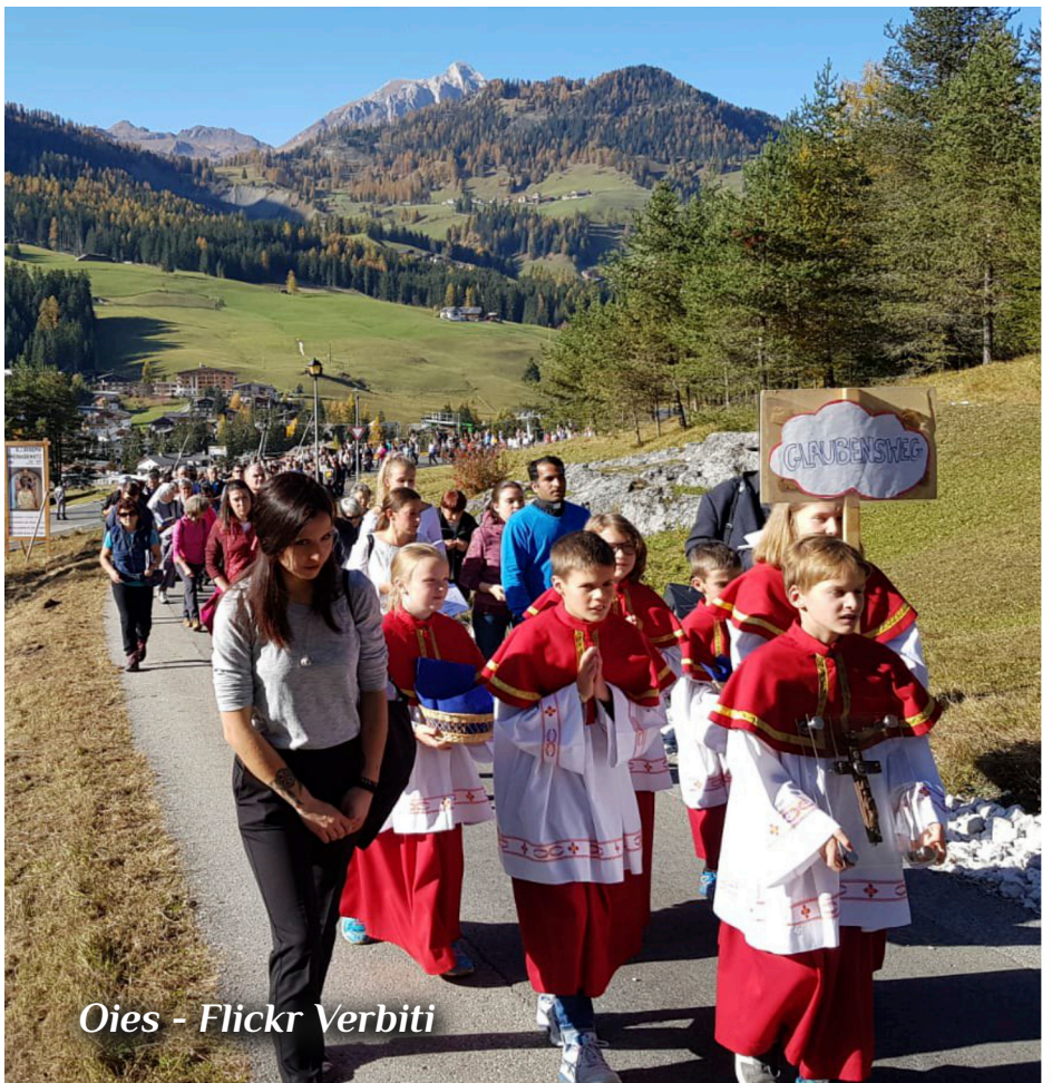
Oies