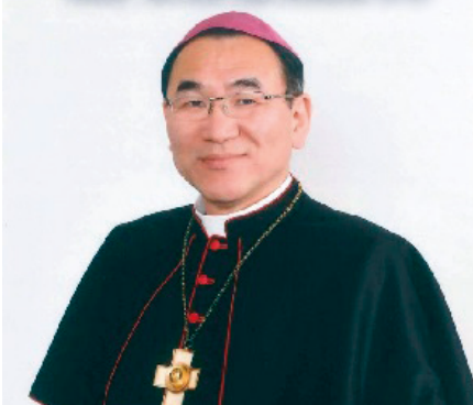
Mons. Tarcisio Isao Kikuchi SVD

ne Caritativa Cattolica cui fanno capo 162 filiali nel mondo. Opera in più di 200 Paesi e si preoccupa di migliorare e difendere le popolazioni povere ed oppresse. Nel suo discorso inaugurale il Presidente ha detto: "Questa Organizzazione deve sempre essere in prima linea nell'accogliere, accompagnare, difendere e servire i poveri e indifesi. Faccio appello a tutti i collaboratori della Caritas nel mondo perché insieme possiamo portare avanti questa importante missione della Chiesa" .