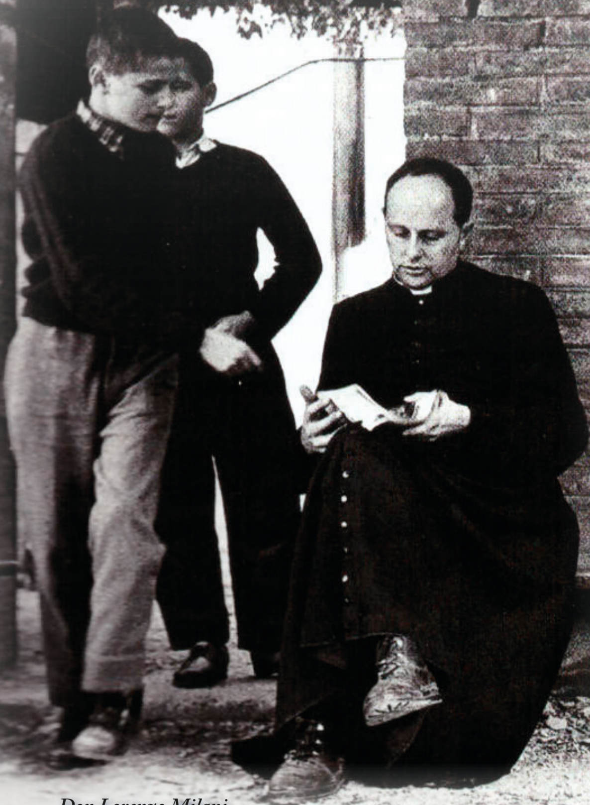
Don Lorenzo Milani