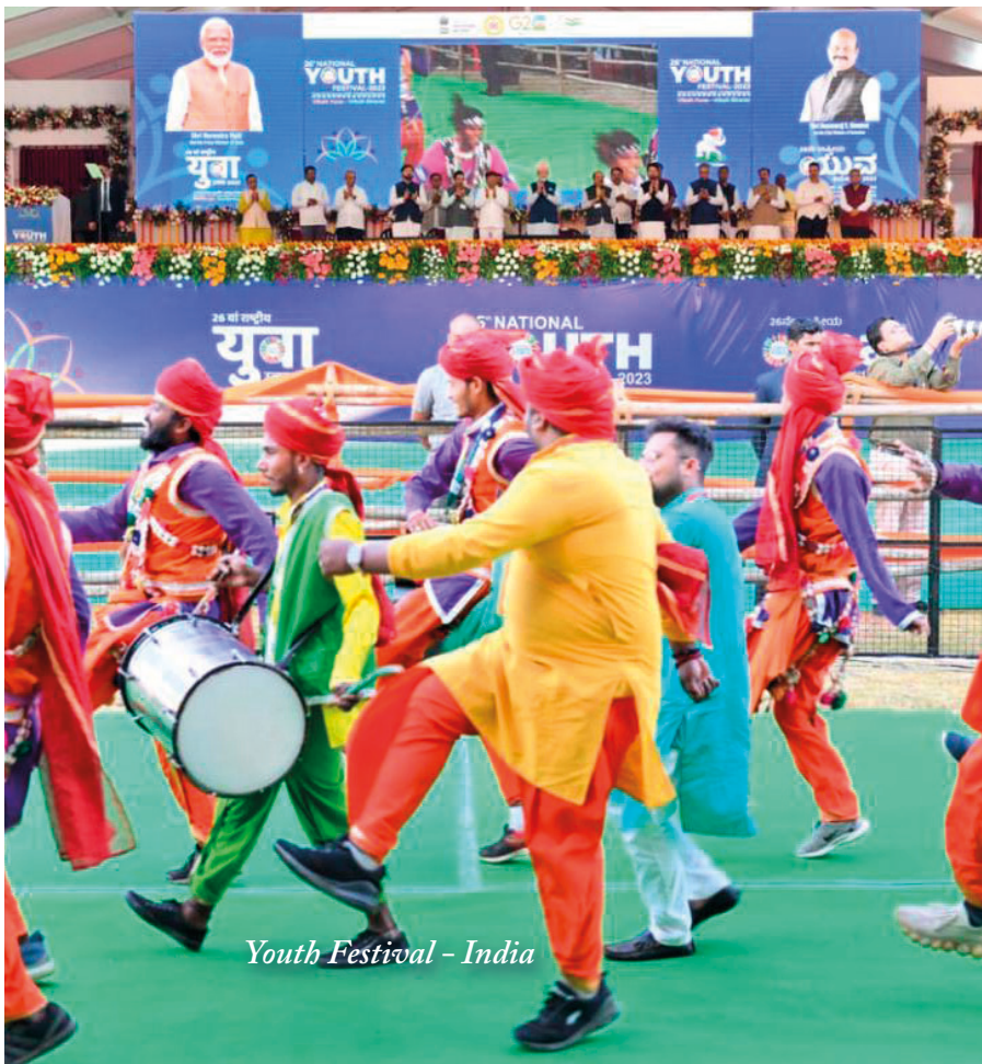
Youth Festival - India

loro destinazione per il lavoro missionario fuori dalla loro patria. Per i candidati al sacerdozio erano poi seguite le ordinazioni diaconali e presbiterali, e, finalmente, nel gennaio 2023 , si erano ritrovati per ricevere la croce missionaria e seguire un corso di orientamento ad affrontare le sfide che li attendono in un Paese straniero.