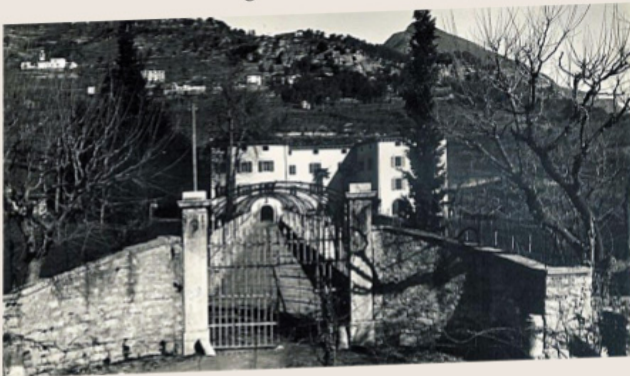
Ingresso anno 1939