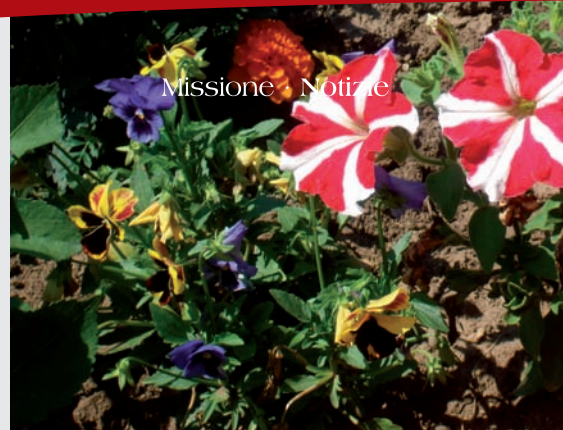
Missione · Notizie

Nei mesi seguenti ho dovuto "allenare" la mia lingua e sforzare la mia gola per poter parlare il difficile idioma olandese. Che idioma! Quattro volte alla settimana, viaggiavo 45 minuti per seguire il corso di lingua olandese presso l'Università di Utrecht. Una notte fredda, tornando a casa in autobus, scorsi l'unico posto a sedere vicino al sistema di riscaldamento. Era ciò di cui avevo proprio bisogno in quel momento: un po' di calore, giacché il freddo stava penetrando in tutte le mie ossa. Però, c'era un piccolo problema... un uomo di circa 45 anni era seduto accanto al posto ancora libero. Sembrava fosse uno di quei "razzisti" che io tanto temevo. Esitavo, ma mi son fatto coraggio e gli ho chiesto se potevo sedermi accanto a lui. La sua reazione mi sorprese e mi impressionò in quanto mi diede il benvenuto e mi invitò calorosamente a sedermi. Dopo alcuni secondi di silenzio, mi domandò cosa stessi leggendo e cosa facessi nella vita... e, per farla breve, quel giorno finii i miei compiti di olandese nell'autobus con lui! Voglio anche precisare che quella persona non frequentava più la chiesa da quando aveva 11 anni.