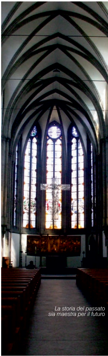
La storia del passato sia maestra per il futuro

Fondata sull'individualismo e antropocentrismo, sulla "volontà di potenza" e sul rovesciamento di rapporto tra produzione e consumo, la modernità ha risposto al problema della presenza di Dio nella realtà cosmica e nella storia aggirandolo: si può vivere, agire, produrre, guadagnare, scoprire, inventare, conquistare "senza bisogno di Dio!". Il mondo occidentale moder-