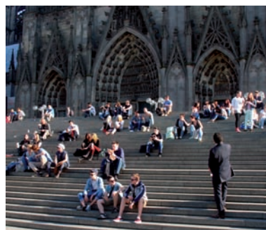
...in attesa, davanti alla Chiesa...

missionari Verbiti INFORMAZIONE E ANIMAZIONE MISSIONARIA