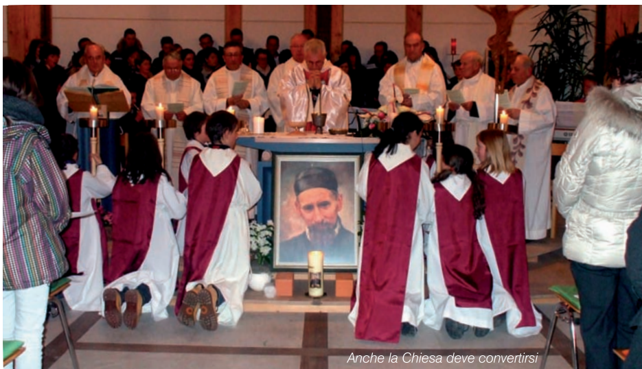
Anche la Chiesa deve convertirsi

Cercherei poi di approfondire le cause di tale situazione. Perché ad esempio la chiesa cattolica da chiesa di popolo è diventata chiesa minoritaria? Potrei formulare diverse ipotesi: la gente è diventata più razionale e crede solo in ciò che è