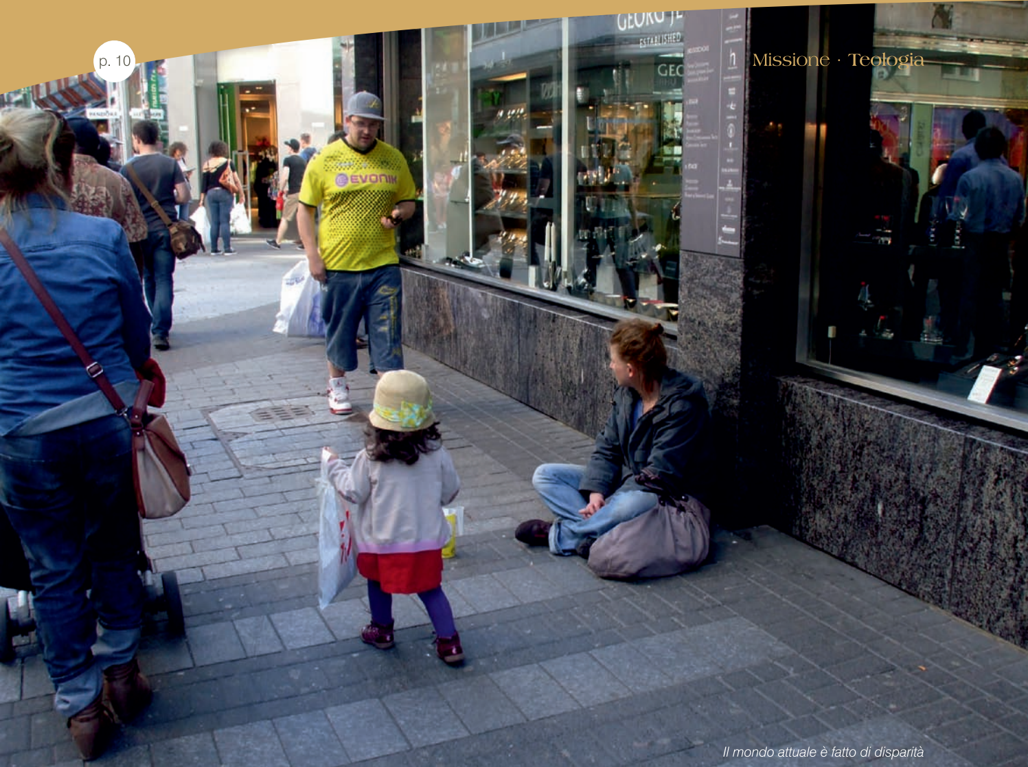
Il mondo attuale è fatto di disparità

provabile scientificamente; la gente ha meno bisogno di miracoli dato il progredire delle scienze mediche; la gente, soprattutto i giovani, non accetta molti insegnamenti della chiesa cattolica specialmente in riguardo al ruolo della donna, alla sfera matrimoniale e all'esercizio della sessualità; molta gente, che non aderisce agli insegnamenti della chiesa, si sente esclusa dalla sua vita sacramentale; altre fedi cristiane o religiose sono più attraenti; i crescenti matrimoni misti tendono a far diminuire l'importanza della religione nella vita domestica; la gente si allontana a causa del comportamento scandaloso di preti e religiosi, ed anche di istituzioni rette da ecclesiastici; i media presentano una società che non dà spazio alla sfera religiosa; l'esempio di molti personaggi famosi che si dichiara-