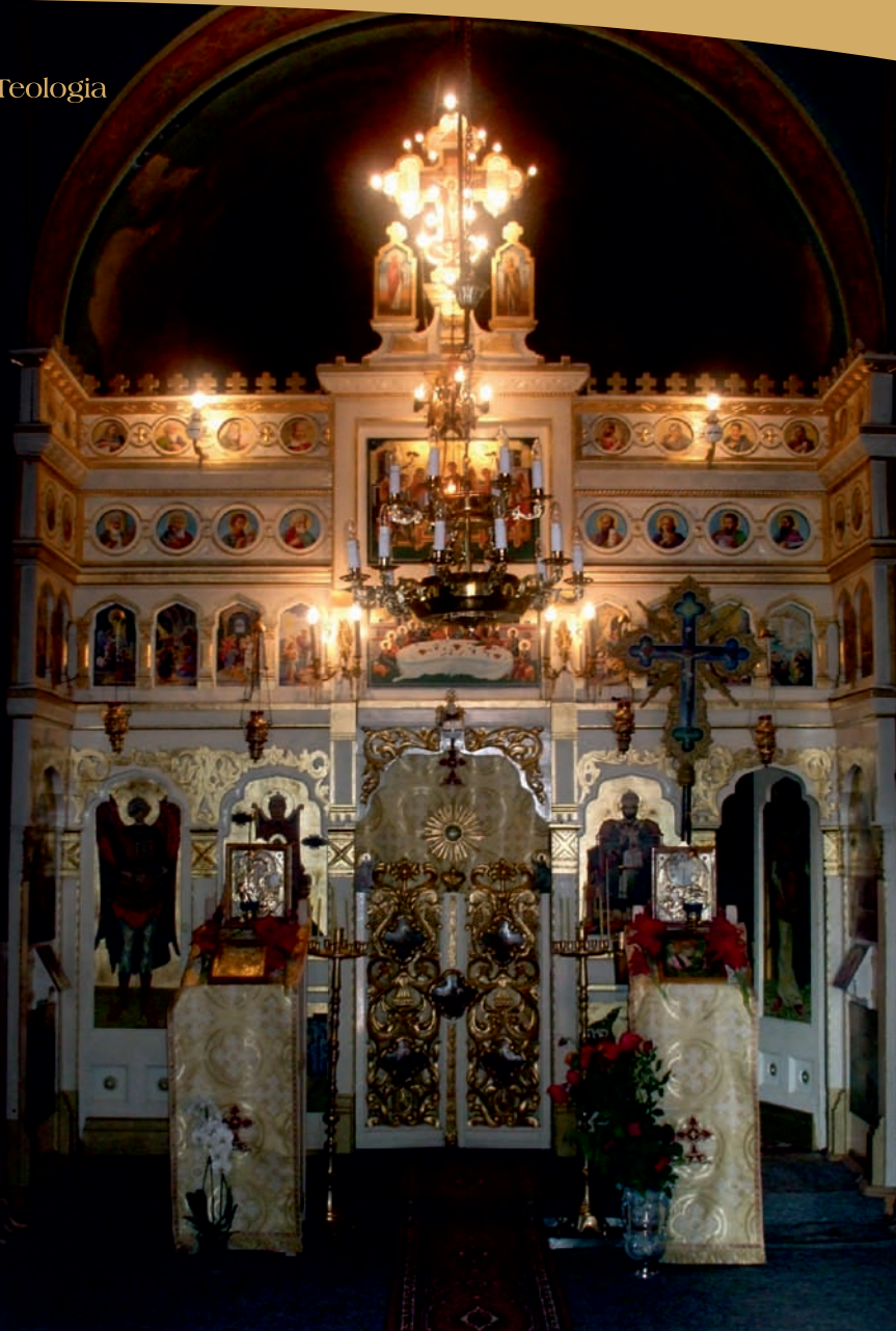
L'unità dei Cristiani è la via del futuro.

corretto, o semplicemente della pressione delle mode più recenti. Questa libertà attinge a una fonte più profonda, a una risorsa inesauribile. All'inizio parlavo dell'affascinante fenomeno del rapido diffondersi del cristianesimo ai suoi albori. Tra le ragioni che poterono a questo fenomeno ne vedo una in particolare: l'espansione ha a che fare con Colui che diede alla chiesa una chiara missione e questa promessa: "Ecco, io sono con voi tutti i giorni, fino alla fine del mondo" (Mt 28,20). Gesù Cristo stesso ne è il garante e continua ad esserlo nelle più differenti modalità. Ciò spiega la