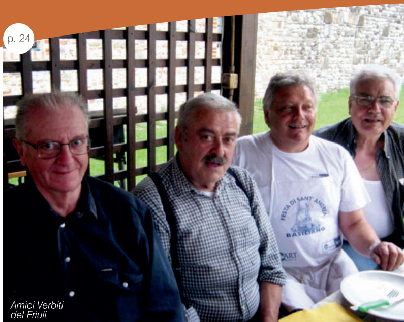
Amici Verbiti del Friuli